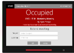
DS-1070 | 10"