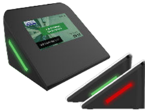
WS-0350 | 4" Arbeitsplatzbuchungsdisplay

Wir bieten ein umfangreiches Angebot an Displays an. Eine Auswahl unserer Displays für Arbeitsplatzbuchung und Besprechungsübersichten finden Sie hier.