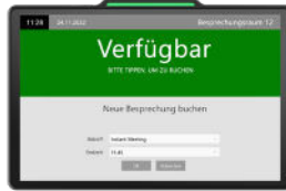
DS-1060 Slim | 10"

Wir bieten ein umfangreiches Angebot an Displays an. Eine Auswahl unserer Displays für Arbeitsplatzbuchung und Besprechungsübersichten finden Sie hier.