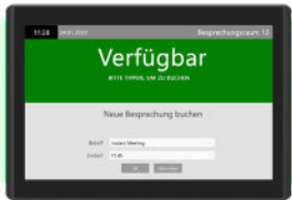
DS-JAR101-MR | 10"