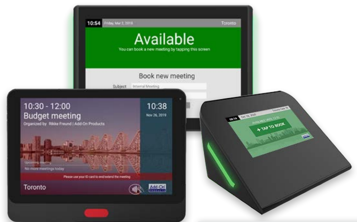
4" Arbeitsplatz-Displays | WS-0350