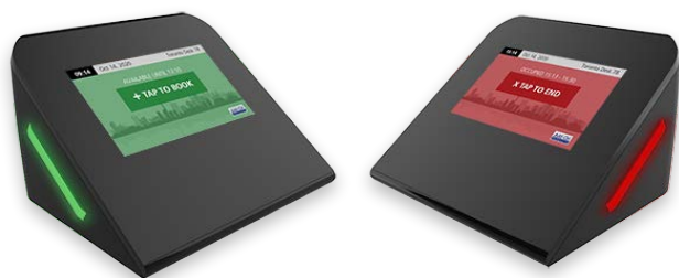
4" Arbeitsplatz-Displays | WS-0350