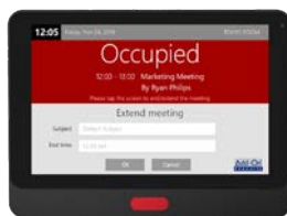
DS-1050 | 10"