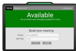
DS-1060 Slim | 10"

Forskellige skærme til forskellige behov - vi dækker det hele. Udvalgt dækker over enheder til reservering af skriveborde og større skærme til mødeoversigter for flere rum.