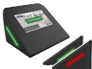
WS-0350 | 4"

Forskellige skærme til forskellige behov - vi dækker det hele. Udvalgt dækker over enheder til reservering af skriveborde og større skærme til mødeoversigter for flere rum.