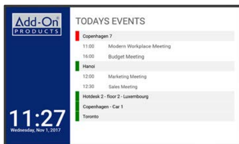
VL800 | 49"